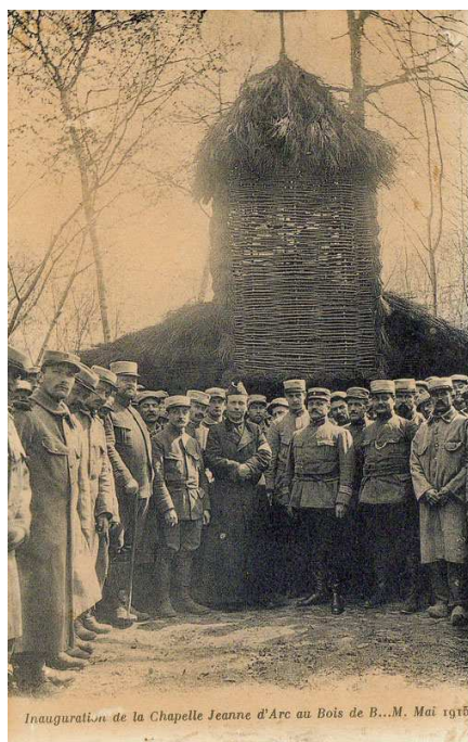
Inauguration de la Chapelle Jeanne d'Arc au Bois de B...M. Mai 1915.

Croix de guerre, Etoile de bronze Médaille militaire