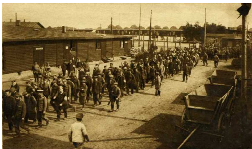
Les prisonniers au camp de Munster de retour des corvées.