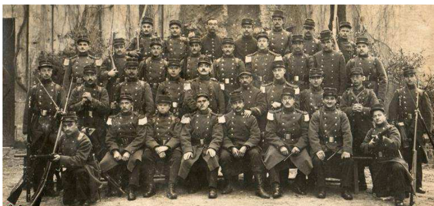
La 24e section de commis et ouvriers militaires d'administration du Gouvernement militaire de Paris