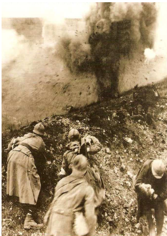
Cote 304, le 5 mai 1916