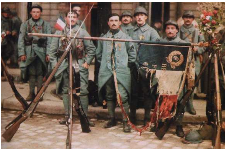
Cliché avec le drapeau en lambeaux du 66ème RI