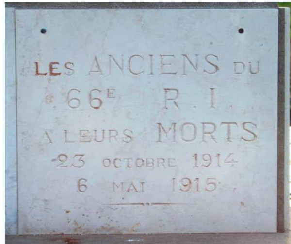
Cette plaque, dans le cimetière français d'Ypres, rappelle les combats du 66ème R.I. lors de la première bataille d'Ypres (Belgique)