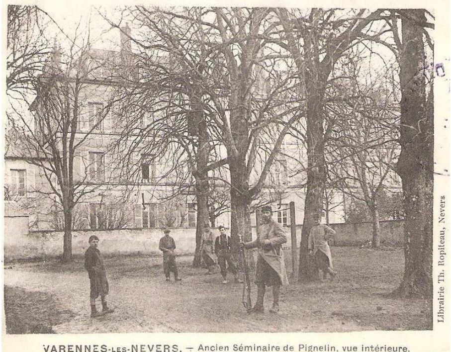
VARENNES-LES-NEVERS. — Ancien Séminaire de Pignelin, vue intérieure.

en vue de leur réforme ultérieure, les soldats accueillis dans l'un des quatre hôpitaux-sanatoria nationaux, lorsqu'en dépit des soins spéciaux qui leur étaient prodigués, aucune amélioration de leur état de santé n'était constatée.