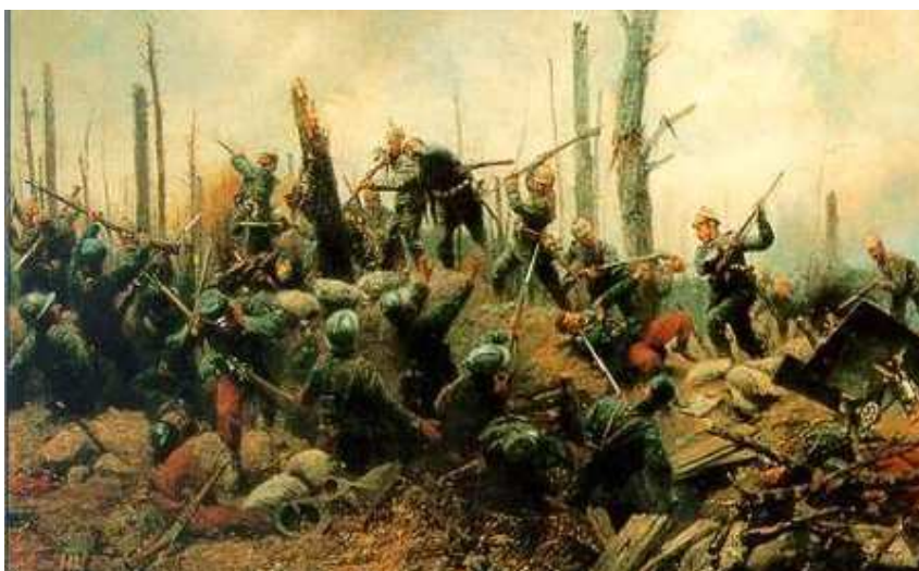
Peinture. Combats en forêt d'Argonne