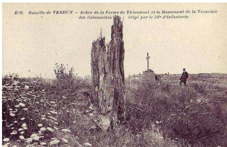
Bataille de Verdun. Arbre de la ferme de Thiaumont et le monument de la Tranchée des Baïonnettes érigé par le 137 e d'Infanterie.

Aux armées du 25 février 1916 au 24 mai 1916.