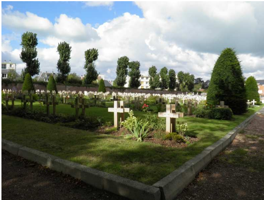
Carré militaire du cimetière communal de Dieppe Seine Maritime 269 Soldats Français, 37 Belges et 3 du Commonwealth y reposent

Son lieu de sépulture est à Dieppe (76 – Seine Maritime ) dans le Carré communal 'DIEPPE' Type de sépulture : Tombe individuelle N°1068.