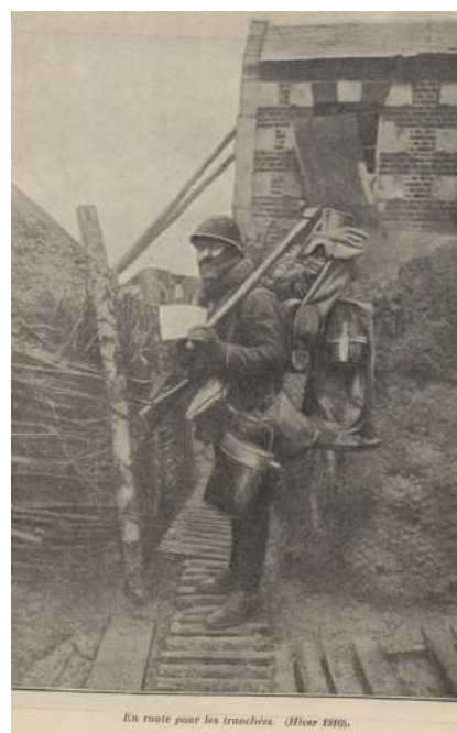
En route pour les tranchées. Hiver 1916