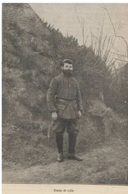
Tenue de ville.