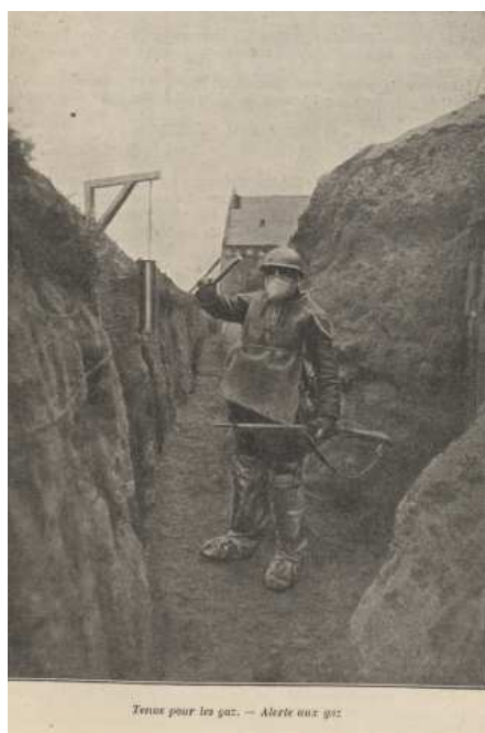
Tenue pour les gaz. Alerte au gaz.